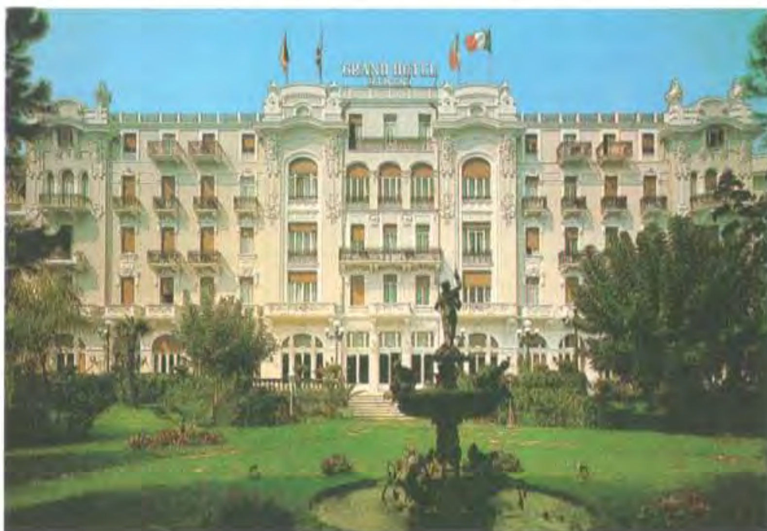
Il Grand Hotel oggi

A proposito del lastrico solare, finalmente una risposta convincente ai tanti interrogativi. Intendo assicurare che la prevista ricostruzione, fortemente desiderata e promossa da Federico Fellini, delle due cupole moresche nel lastrico solare del Grand Hotel di Rimini, distrutte dal ben noto incendio del 1920, nasce dopo un esauriente particolareggiato studio delle future necessità di servizi e spazi indispensabili per restare in sintonia con il progresso e le, già citate, crescenti esigenze dell'ospite del 2000. Prescindendo dalla praticità e funzionalità dell'opera, l'utilizzazione degli spazi del lastrico giocherà non solamente a